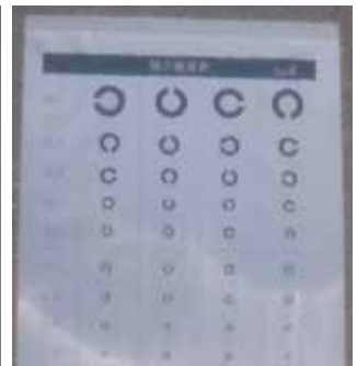
●スーパーダイヤスター