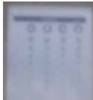
●美サンランスーパーダイヤスター