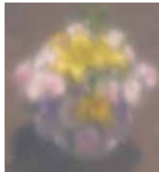
●美サンランスーパーダイヤスター