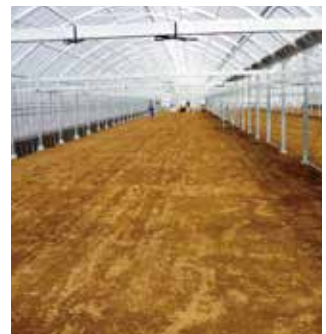
●九州N様 ・晴天だがパイプの影がほとんど見えない