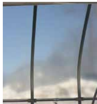
●北海道M様 ・やわらかく展張しやすかった